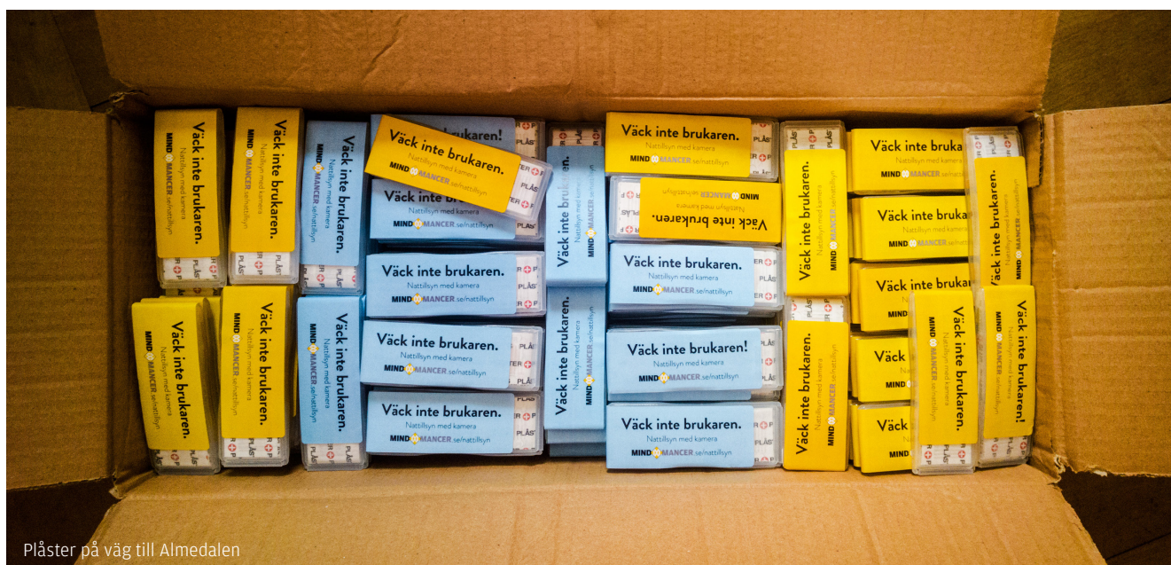
Plåster på väg till Almedalen