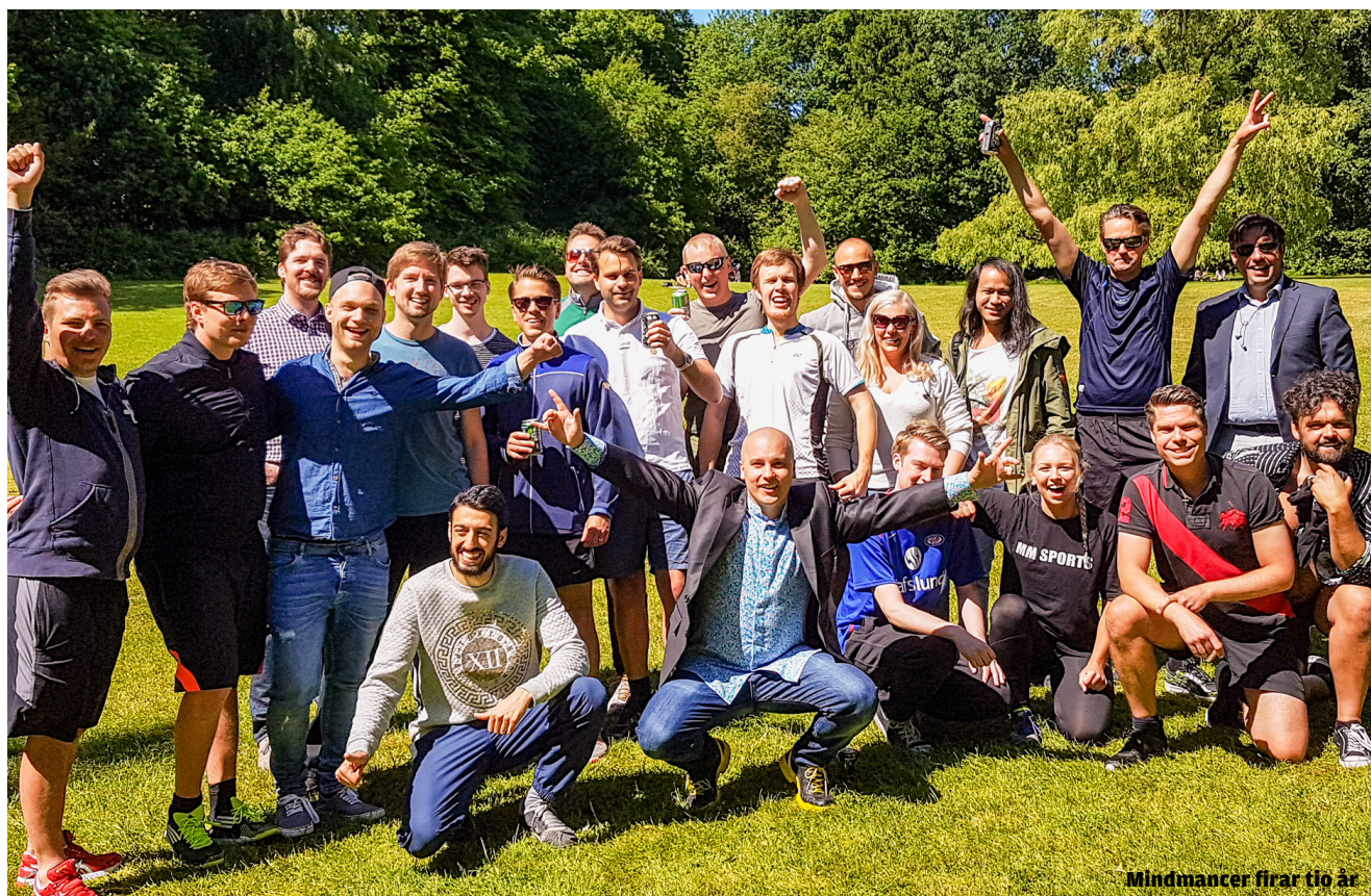
Mindmancer firar tio år